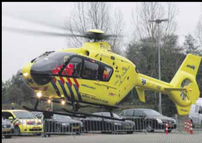
BEZOEK VAN EEN TRAUMAHELI TIJDENS DE AMBULANCE VAKBEURS