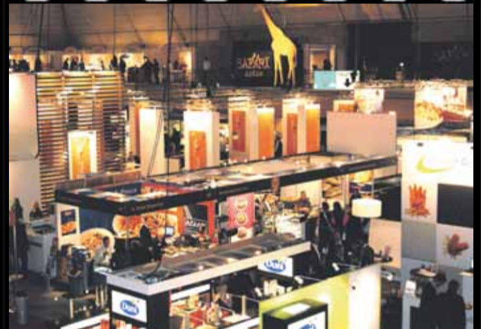
DELI XL FOODSERVICE FAIR 2010 - SPETTEREND SUCCES!