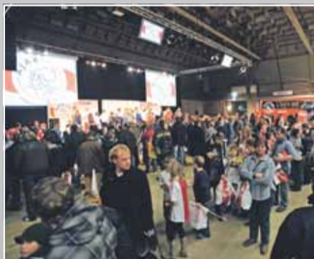
🕒 Dinsdag 1 februari - 19.00 uur