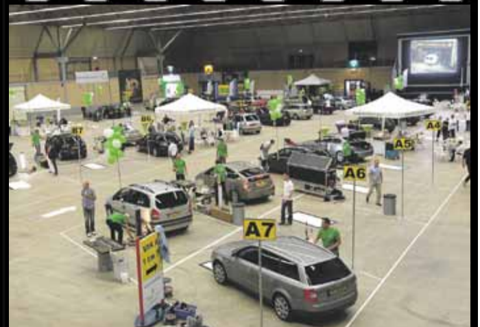
EEN GROTE HERSTELWERKPLAATS VOOR DE KLEINE DEUKJES DAGEN