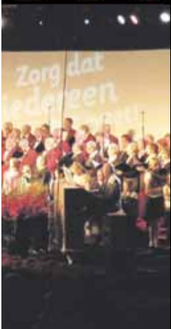
AVONDVULLEND CONCERT VAN DE AMERICAANSE GAITHER VOCAL BAND