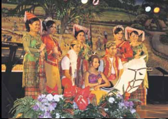
SUCCESVOLLE OPTREDENS TIJDENS DE AZIATISCHE PASAR MALAM