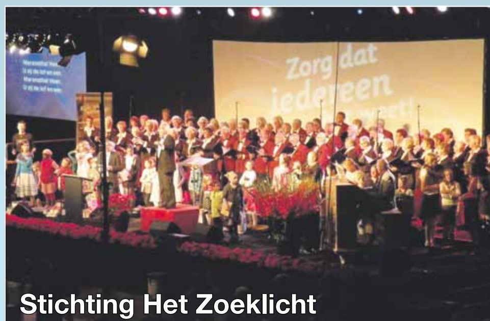
Stichting Het Zoeklicht