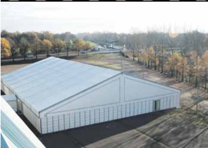
EXTRA 2000 m2 VLOERCAPACITEIT MET EEN TENT VAN NEPTUNES