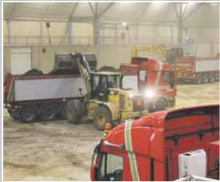
🕒 Maandag 31 januari - 17.00 uur

Weliswaar doofde het motorgeweld 's zondags om 19 uur, maar pas in de nachtelijke uurtjes kon het projectteam aan de slag. Eerst moest de organisatie van het crossevenement al zijn materialen en middelen opruimen. De mouten werden flink opgestroopt. Maar liefst 75 vrachtwagenladingen zand werden verwijderd, waarna het echte schoonmaakwerk kon beginnen. Afvoeren, vegen en poetsen.