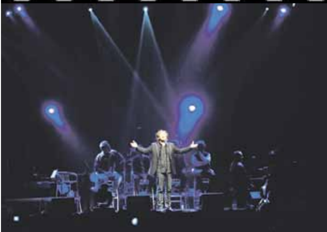
AVONDVULLEND CONCERT VAN DE AMERICAANSE GAITHER VOCAL BAND