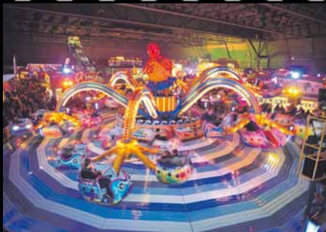
FLITSSENDE ATTRACTIES TIJDENS DE JAARLIJKSE INDOORKERMIS