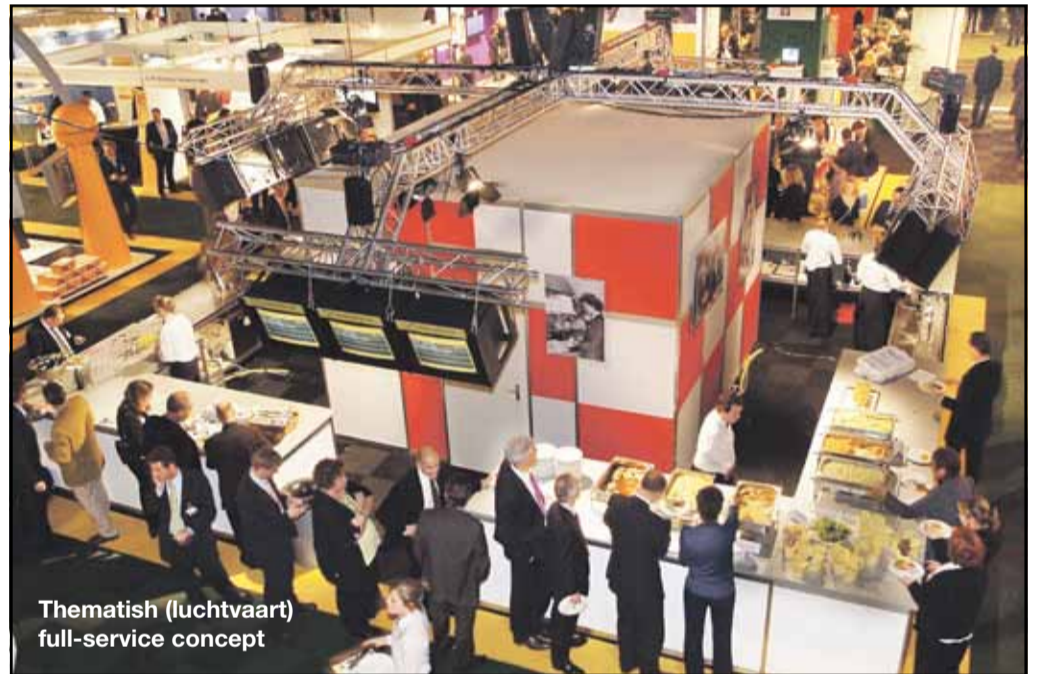
Thematish (luchtvaart) full-service concept

van de Americahal. De achter ons liggende periode kende een variëteit aan evenementen met dito catering. Zoals een massaal evenement met een meer basic catering, een intiem hoogwaardig evenement met bijbehorende exclusieve hapjes en een grootschalige full-service bijeenkomst met een ver doorgevoerde uitstraling rond het thema luchtvaart.