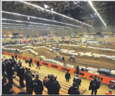
🕒 Zondag 30 januari - 17.00 uur

Het projectorganisatieteam van de Americahal stond na afloop van de spectaculaire crosswedstrijden voor een flinke uitdaging. Een mega-klus. In één etmaal de hal ombouwen van zandbak tot een keurige locatie voor het supportersfeest van Ajax: een race tegen de klok.