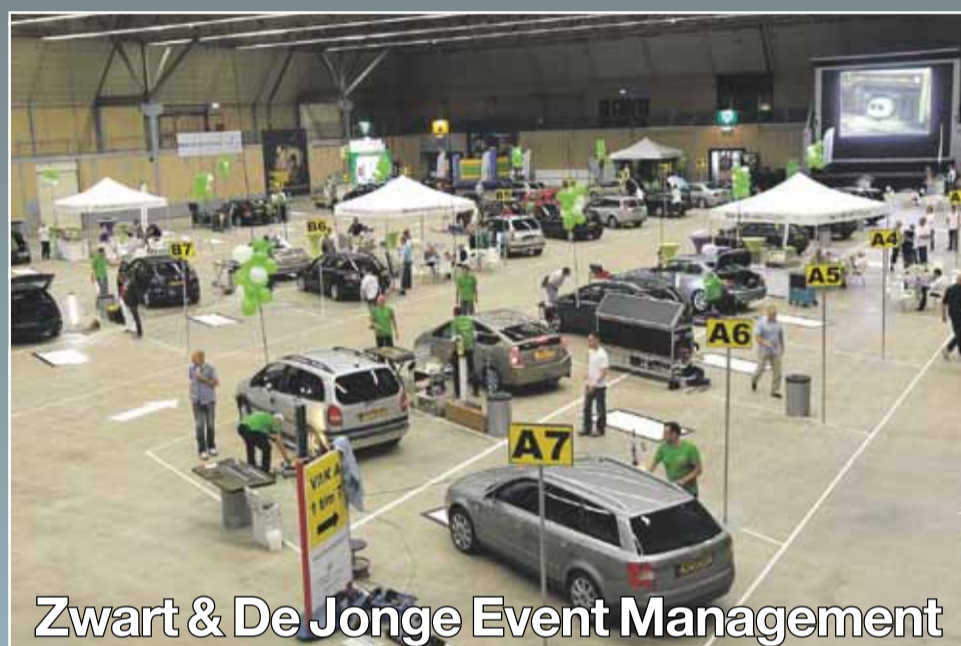
Zwart & De Jonge Event Management

„De beslissing om de Americahal als locatie te kiezen, bleek een schot in de roos. Waarom? De facilitaire ondersteuning vanuit de Americahal was ongekend. Daarnaast leent deze locatie zich uitstekend voor dit evenement, daar alle nodige faciliteiten aanwezig zijn. Een grote hoeveelheid relaties koos ervoor om met het hele gezin naar Apeldoorn te komen. Bij de entree werden ze hartelijk ontvangen door eigen medewerkers van Centraal Beheer Achmea en werd hun e-ticket gescand. Vervolgens loodsten professionele traffic controllers hen door de schadeherstelroute waar men meteen drie kleine deukjes kon laten repareren. De service ging nog verder. Wanneer er in de voorruit van de auto ook nog een sterretje werd geconstateerd, was er tevens gelegenheid om ook dit te laten repareren.” „Zoals we al verwachtten, was het een komen en gaan van auto’s. Het was een logistieke uitdaging om die grote stroom soepel te laten verlopen. Zowel binnen als buiten. Dit logistieke proces van maar liefst 450 auto’s in een vloeiende beweging in goede banen te leiden is mede dankzij de ondersteuning van de Americahal perfect verlopen. Dankzij het grote succes van de eerste editie, werd besloten om in Apeldoorn al na een half jaar een tweede editie te houden. Over de locatie waren we er snel uit: de Americahal”.