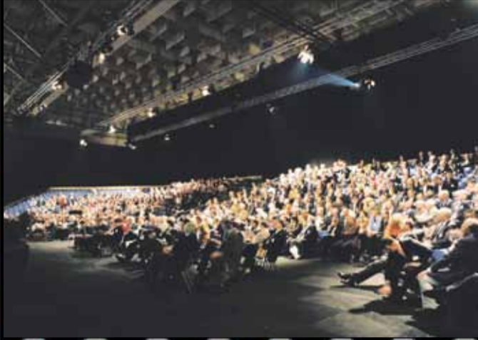
OPTIMALE CONGRESOPSTELLING MET 1200 TRIBUNEZITPLAATSEN