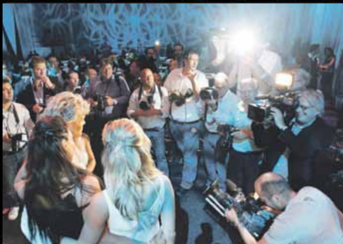
DE VOLTALLIGE NEDERLANDSE FOTOPERS AANWEZIG BIJ HANS KLOK