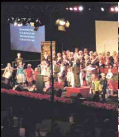
STICHTING HET ZOEKLICHT MET EEN GESLAPEN TOEGEDAG 2010